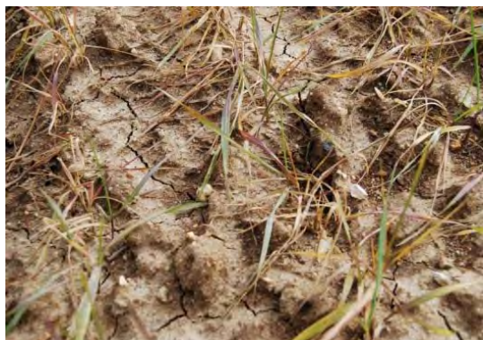
Photo : plantes chétives, rougissement et jaunissement à la fin de l'hiver.